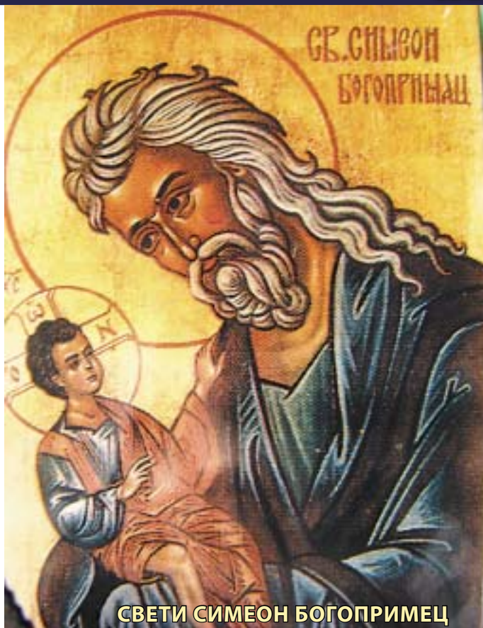
СВЕТИ СИМЕОН БОГОПРИМЕЦ

те на Божјиот слуга, прво-свештеникот Захариј, што имало исто значење како да го предала во рацете на Са-миот Бог.