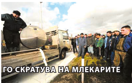
ГО СКРАТУВА НА МЛЕКАРИТЕ

да ги насочи другите средства кон фармерите, зашто тоа е еден од условите млекарницата да продолжи со работа", вели вицепремиерот Зоран Ставрски.