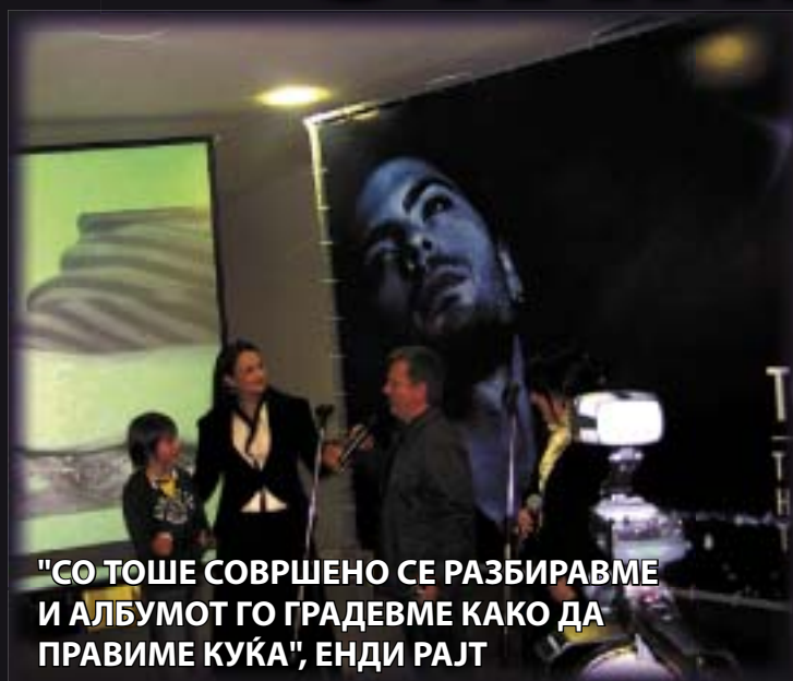
"СО ТОШЕ СОВРШЕНО СЕ РАЗБИРАВМЕ И АЛБУМОТ ГО ГРАДЕВМЕ КАКО ДА ПРАВИМЕ КУЌА", ЕНДИ РАЈТ