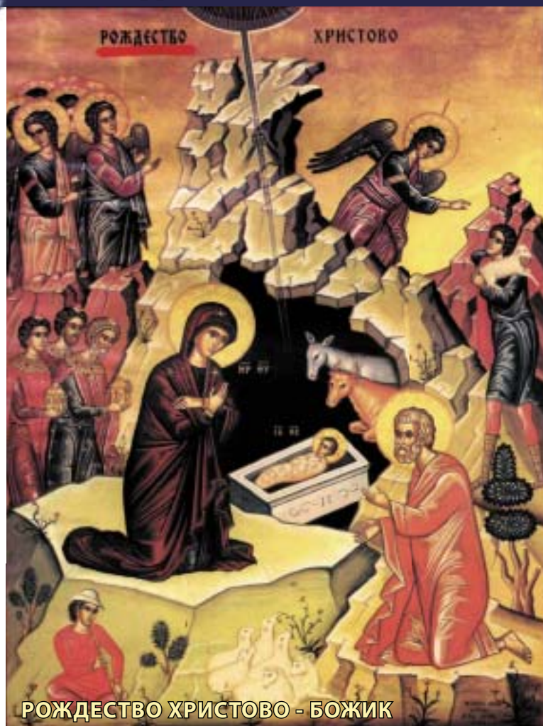
РОЖДЕСТВО ХРИСТОВО - БОЖИК

Христос се роди во Тело. Синот Божји стана Син Човеч- ки. Зошто? За да нè направи и