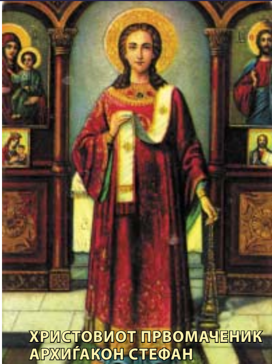
ХРИСТОВИОТ ПРВОМАЧЕНИК АРХИГАКОН СТЕФАН