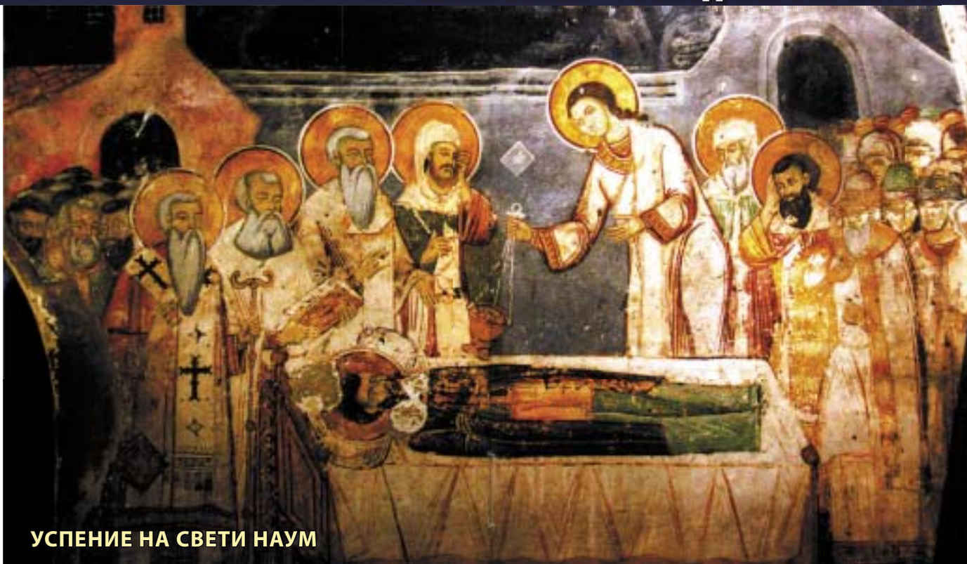
УСПЕНИЕ НА СВЕТИ НАУМ