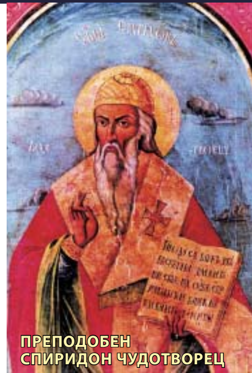
ПРЕПОДОБЕН СПИРИДОН ЧУДОТВОРЕЦ

Свети Николај присуствувал на Првиот Вселенски Собор во Никеја, во 325 година. На овој Собор Ариј, со своето погрешно учење, ја нарушувал најважната догма во нашата Црква - Света Троица, го хулел името на Синот Божји и на Богородица. Свети Николај, храбро стојејќи против безбожното учење на Ариј, на Соборот јавно пред 318 епископи му удрил шлаканица. Затоа веднаш Свети Николај го отстраниле од Соборот и му го одзеле архиерејскиот чин. Но, набрзо Светите Оци му го вратиле архиерејскиот чин, заради визијата при која ги виделе Бог и Богородица како му го враќаат чинот. Свети Николај се разболел и се упокоил во Бога тивко, во 343 година, на