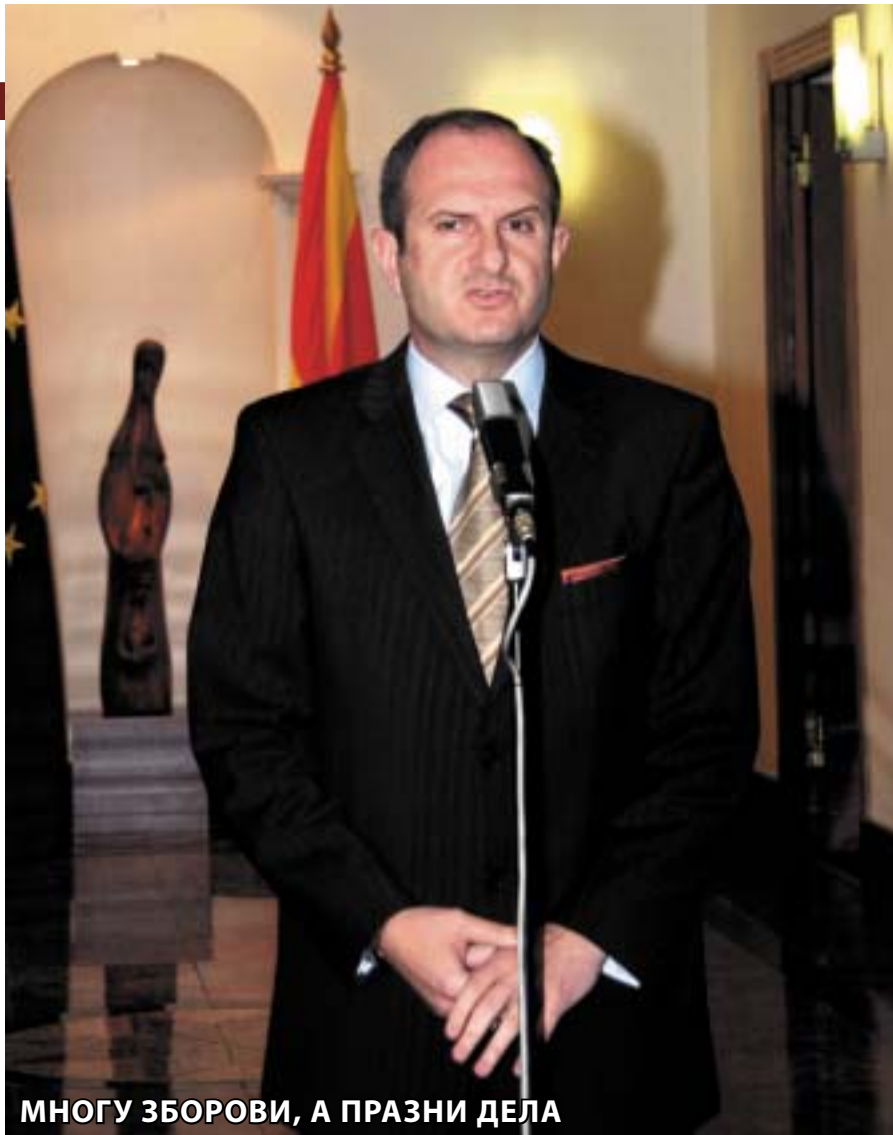
МНОГУ ЗБОРОВИ, А ПРАЗНИ ДЕЛА

"Како граѓанин имам непријатно чувство по пресудата за господинот Бучковски. Кај нас практично сè се политизира и мириса на партизација на институциите. Немам информации според кои мо-