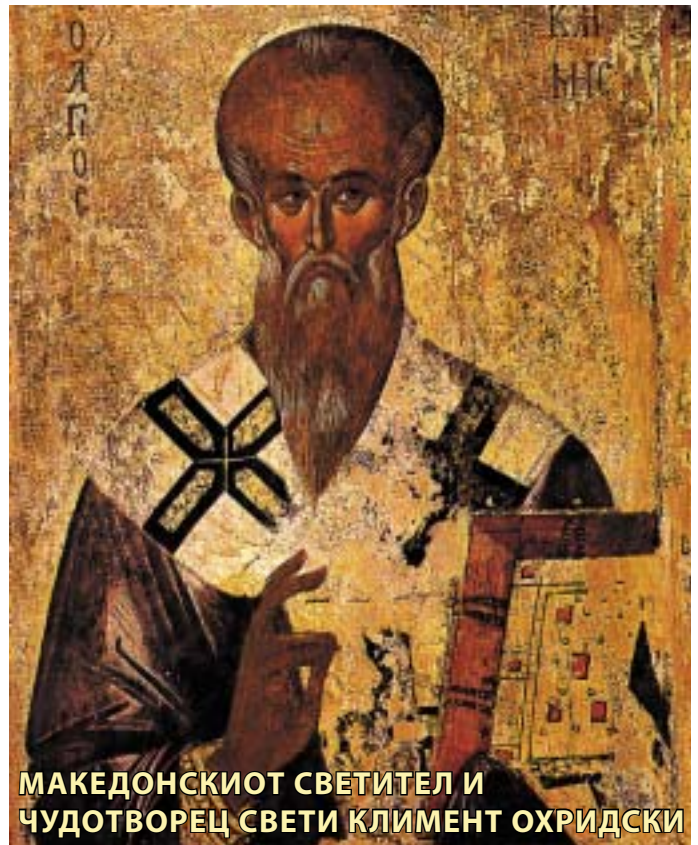
МАКЕДОНСКИОТ СВЕТИТЕЛ И ЧУДОТВОРЕЦ СВЕТИ КЛИМЕНТ ОХРИДСКИ

На 8 декември во нашата татковина Македонија и секаде во светот каде што се наоѓаат Македонци, најдостоинствено ќе засвонат камбаните на Христовата црква. Тие ќе го најават славењето во чест на вечниот небесен граѓанин, бесмртен великан, великопроповедник и апостол, Св. Климент Охридски, кој со своите дела го овековечил не само своето име, туку и името на својот народ и родната Македонија. Тој заедно со останатите "Седмочисленици" (Светите Кирил, Методиј, Наум, Сава, Горазд, Ангелариј) не дозволи македонскиот народ да потпадне под туѓински влијанија и да се откаже од својата прадедовска вера. Овој најталентиран ученик на Светите Кирил и Методиј, прв ма-