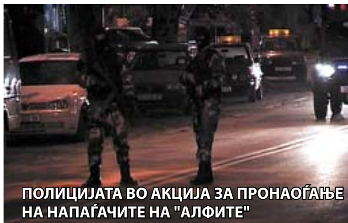
ПОЛИЦИЈАТА ВО АКЦИЈА ЗА ПРОНАОЃАЊЕ НА НАПАГАЧИТЕ НА "АЛФИТЕ"

друг сектор, од една во друга држава, бидејќи регионот сè уште не е ситуиран, ние сè уште сме надвор од ЕУ и од НАТО, каде има повисоки стандарди на обезбедување на границите", истакнува Трајан Гоцевски, поранешен министер за одбрана на РМ.