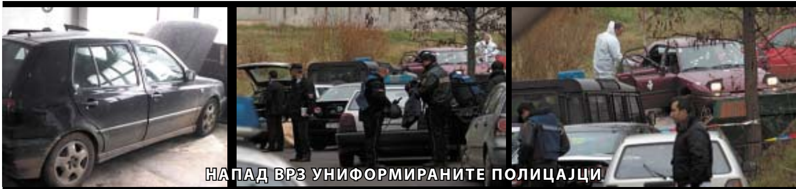
НАПАД ВРЗ УНИФОРМИРАНИТЕ ПОЛИЦАЈЦИ