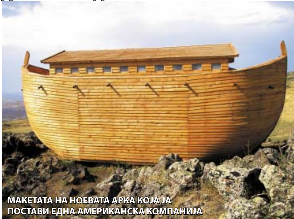
МАКЕТАТА НА НОЕВАТА АРКА КОЈА ЈА ПОСТАВИ ЕДНА АМЕРИКАНСКА КОМПАНИЈА