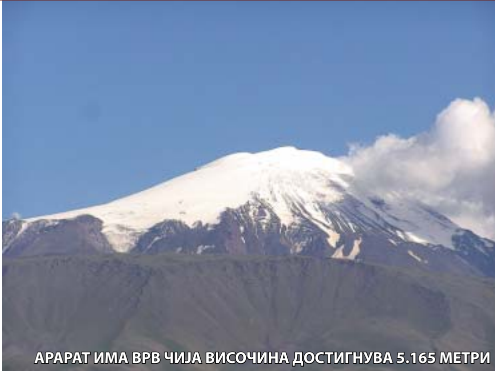
АРАРАТ ИМА ВРВ ЧИЈА ВИСОЧИНА ДОСТИГНУВА 5.165 МЕТРИ