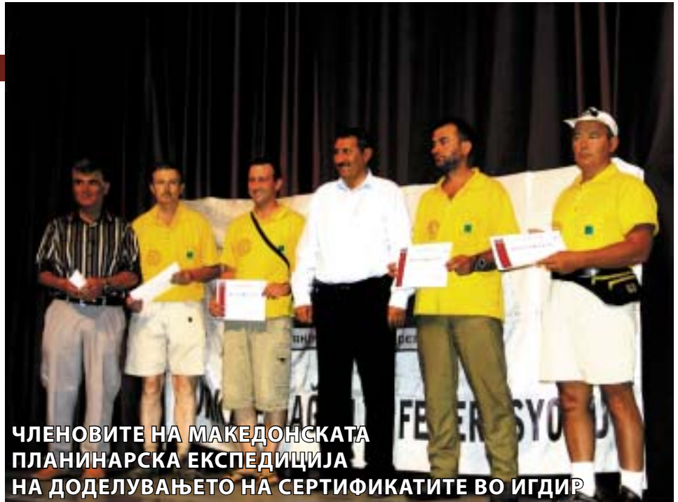
ЧЛЕНОВИТЕ НА МАКЕДОНСКАТА ПЛАНИНАРСКА ЕКСПЕДИЦИЈА НА ДОДЕЛУВАЊЕТО НА СЕРТИФИКАТИТЕ ВО ИГДИР

Следниот ден рано утрото околу 4 часот се упативме кон врвот. Додека се движевме постојано моравме да носиме дерези, цепин, бидејќи одевме по глечери, кои имаат многу процепи, кои се покриени со снег. Движењето беше исклучително во навеза, односно со јажиња. На врвот пристигнавме по 6-7 часа пешачење. По задолжителното фотографирање и снимањето со видеокамера со македонското знаме и знамето на спонзорот, поради лошото време моравме веднаш да се симнеме до 4.200 м од каде, по собирањето на шаторите и на другата опрема, се упативме по камениот стрмен терен до 3.200 м каде нокевавме. Следниот ден се симнавме на