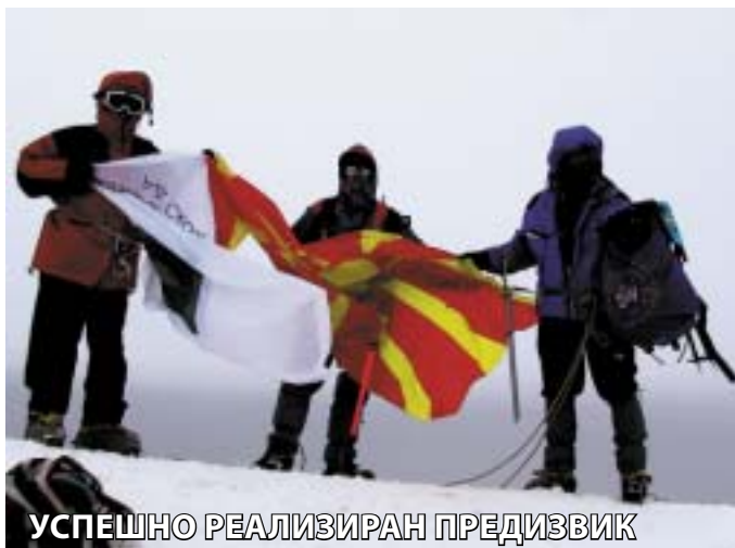
УСПЕШНО РЕАЛИЗИРАН ПРЕДИЗВИК

народно искачување на Арарат, со поддршка од турската Влада. Ова е единствена прилика за сите кои сакаат да го освојат овој врв на најбезбеден начин. Секоја година ТПФ го организира искачувањето со големо воено обезбедување, на кое учествуваат голем број