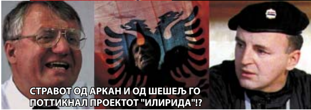
СТРАВОТ ОД АРКАН И ОД ШЕШЕЉ ГО ПОТТИКНАЛ ПРОЕКТОТ "ИЛИРИДА"?

духови го негираат ова објаснување на основоположниците на тој заговор против Македонија. Се поставува прашањето дали идејата за создавање на "Илирида" е испровоцирана од постојаните влегувања на Аркановци и Шешеловци во Гостиварско, Вратница и Милетино во тој период, како одбранбен механизам од напливот на српските четнички орди во тој период или сè тоа