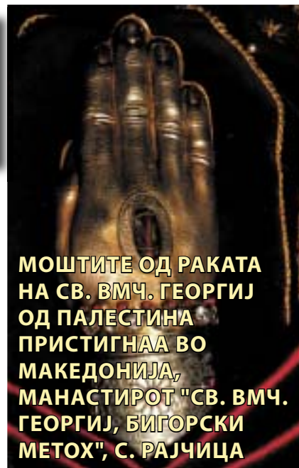
МОШТИТЕ ОД РАКАТА НА СВ. ВМЧ. ГЕОРГИЈ ОД ПАЛЕСТИНА ПРИСТИГНАА ВО МАКЕДОНИЈА, МОНАСТИРОТ "СВ. ВМЧ. ГЕОРГИЈ, БИГОРСКИ МЕТОХ", С. РАЈЧИЦА