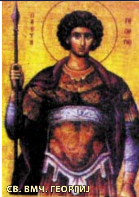
СВ. ВМЧ. ГЕОРГИЈ