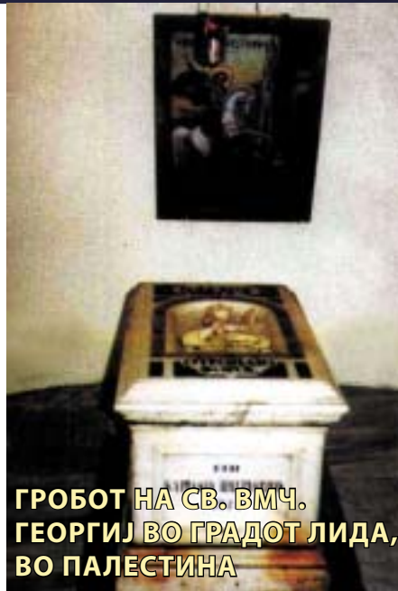
ГРОБОТ НА СВ. ВМЧ. ГЕОРГИЈ ВО ГРАДОТ ЛИДА, ВО ПАЛЕСТИНА