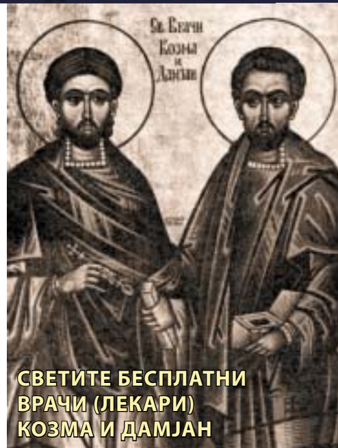
СВЕТИТЕ БЕСПЛАТНИ ВРАЧИ (ЛЕКАРИ) КОЗМА И ДАМЈАН

во местото Фереман, во Месопотамија. Нивните свети мошти ги положили заедно, на исто место. Фереман го раз-