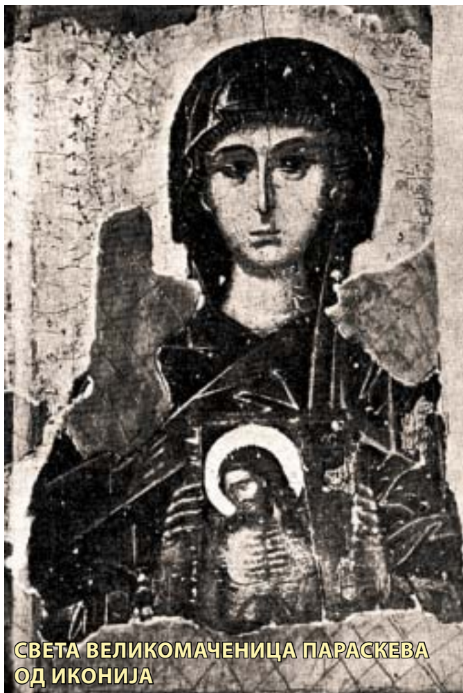
СВЕТА ВЕЛИКОМАЧЕНИЦА ПАРАСКЕВА ОД ИКОНИЈА

рот Максимијан наредувал да се организираат гладијаторски игри во арените во кои биле жртвувани христијани. Нестор длабоко во себе страдал гледајќи како горостасниот Лиј ги измачува христијаните, фрлајќи ги врз многубројните копја и како умираше во најтешки маки. За сè тоа Св. Нестор во затворот го известил Свети Димитриј и решил самиот да излезе на меѓдан со Лиј. Свети Димитриј го благословил и му рекол: "Ќе го победиш Лиј, но ќе настрадаш поради Христа". Нестор, идниот свети маченик, се искачил на бината извикувајќи силно: "Боже на Димитрија, помогни ми". И навистина, Нестор го победил циновскиот Лиј, го фрлил врз остриите копја и тој умрел. За царот и за безбожниот народ тоа било најголемо чудо и најголем пораз. Затоа царот наредил Нестор да биде исечен со меч, а Димитриј избоден со копја.