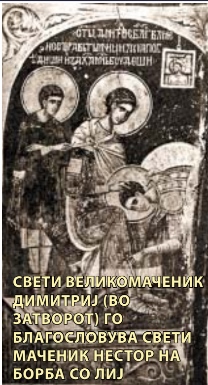
СВЕТИ ВЕЛИКОМАЧЕНИК ДИМИТРИЈ (ВО ЗАТВОРОТ) ГО БЛАГОСЛОВУВА СВЕТИ МАЧЕНИК НЕСТОР НА БОРБА СО ЛИЈ