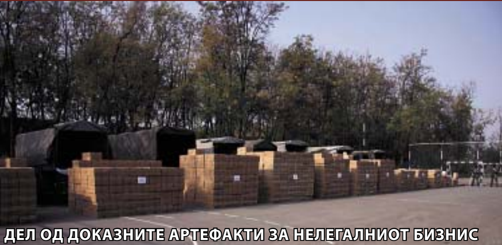
ДЕЛ ОД ДОКАЗНИТЕ АРТЕФАКТИ ЗА НЕЛЕГАЛНИОТ БИЗНИС

Тоа значи дека империјата била уништена само затоа што се "намерачил" на посилен од себе или не платил мито and корупција. Гледано од страна, или поточно под око, многу работи се не-