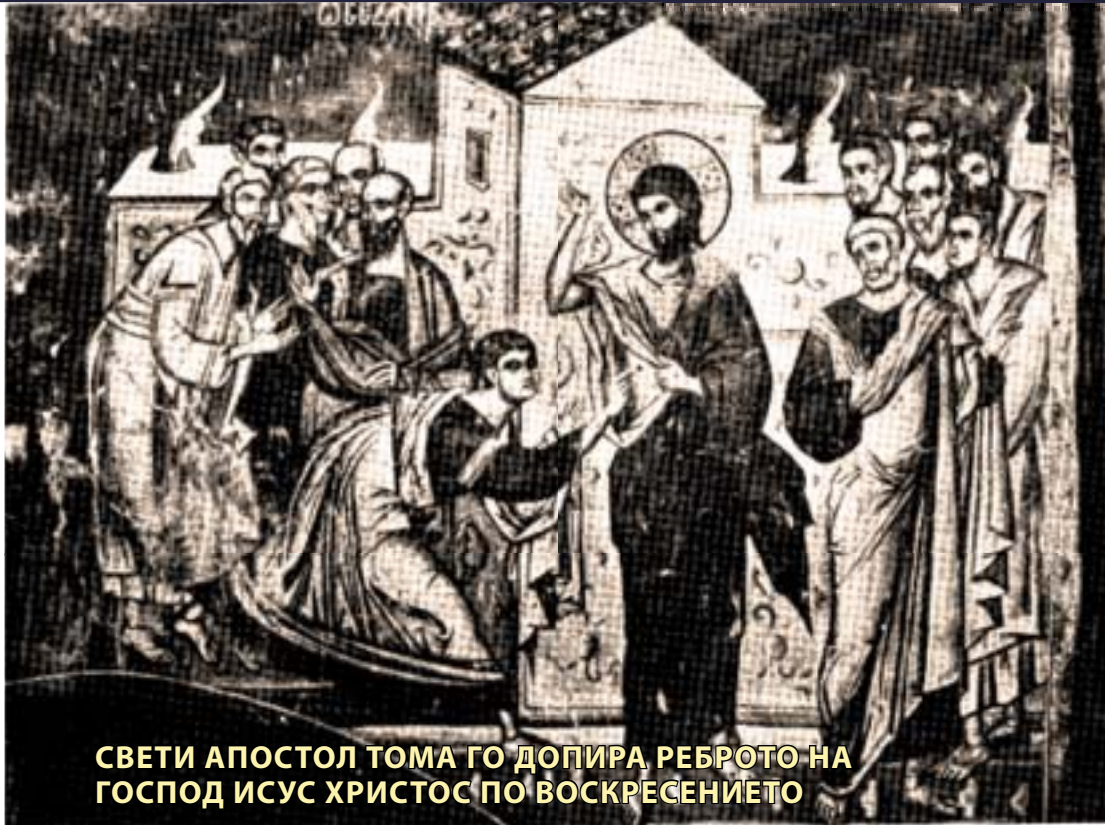
СВЕТИ АПОСТОЛ ТОМА ГО ДОПИРА РЕБРОТО НА ГОСПОД ИСУС ХРИСТОС ПО ВОСКРЕСЕНИЕТО

Но, Тома не стигнал на самиот ден на погребот на Богопрославеното тело на Преблагословената и Пречиста Богородица. Пристигнал третиот ден по Нејзиното Успение. За да ѝ се поклони Тома, апостолите решиле да го отворат