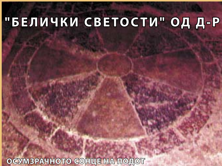
ОСУМЗРАЧНОТО СОНЦЕ НА ПОДОТ

вите "Света Троица" ("Парумба") и "Света Недела" и други свети места.