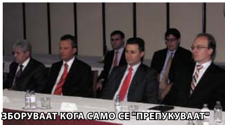
СЕДНУВААТ НА МАСА, НО ЗА ШТО ВСУШНОСТ ЗБОРУВААТ КОГА САМО СЕ "ПРЕПУКУВААТ"

премиерот и претседателот на државата одлучија да се обвинуваат меѓу себе, односно гласно да го кажат сè она што досега го брифираа.