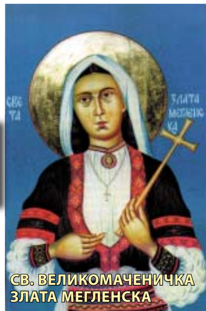
СВ. ВЕЛИКОМАЧЕНИЧКА ЗЛАТА МЕГЛЕНСКА

Првата седмица во октомври (на 7 октомври), на небото торжествува невидливата Христова Црква, а на земјата - видливата Христова Црква и секое Божјо верно создание ги прославува де-