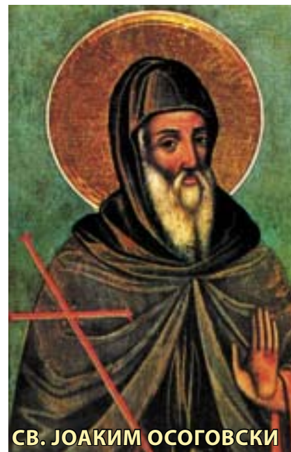
СВ. ЈОАКИМ ОСОГОВСКИ

венец на главата, пред оние кои го распнаа и оние кои се ситеа на неговите страдања. Напротив, се молеше велејќи: "Оче, прости им, оти не знаат што прават!" Доколку погледнеме во далечното минато, а и денес, ќе видиме дека низ историјата во Македонија се раѓале голем број Христови војници, кои умрале бранејќи ја Евангелската вистина, и многу верни и вистински синови на татковината, кои настрадале за нејзината слобода, и сите тие нашле начин на кој човекот ја победува смртта. Но, и покрај тоа, Македонија продолжува да зборува: "Ако, Јас со векови се бранам од сите страни".