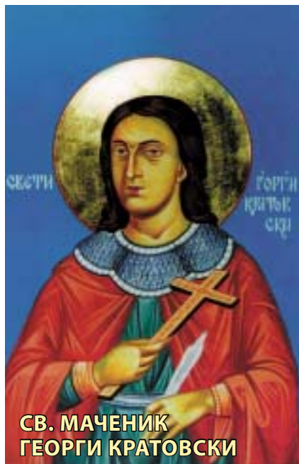
СВ. МАЧЕНИК ГЕОРГИ КРАТОВСКИ

ли; тој нема вредност како ни монетата без слика, без натпис". Тие знаеја дека чувањето на православната вера е најсилното оружје за зачувување на нашата националност.