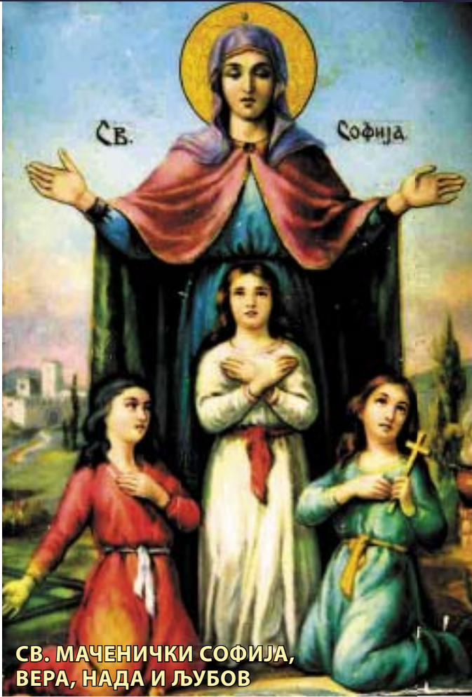
СВ. МАЧЕНИЧКИ СОФИЈА, ВЕРА, НАДА И ЉУБОВ

Бога за ова откритие, плачејќи и крстејќи се пеел: "Господи помилуј!" Царицата Елена во сребрен ковчег го положила Крстот, и му го предала на Ерусалимскиот патријарх за да се чува за идните поколенија. Таа за себе зела дел од Чесното дрво на Крстот, а ги зела и светите клинци.