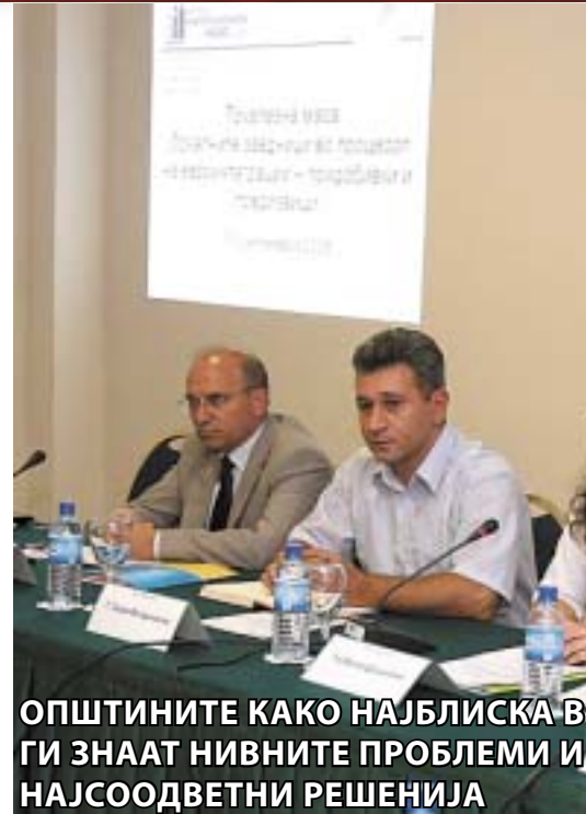
ОПШТИНИТЕ КАКО НАЈБЛИСКА ВГИ ЗНААТ НИВНИТЕ ПРОБЛЕМИ И НАЈСООДВЕТНИ РЕШЕНИЈА

ран во три области, прво - во опфатот на надлежностите, второ - во обезбедувањето на соодветни финансиски средства за извршување на тие надлежности и трето - во организацијата на локалната самоуправа. Сметам дека во првиот дел Македонија сè уште е многу централизирана држава, но и во вториот дел, особено во финансиска смисла, сè уште е најцентрализирана држава во Европа, поцентрализирана и од Босна и Херцеговина и од Косово. Тврдам дека македонските општини располагаат со многу помалку средства во споредба со сите држави во Европа и тоа ги доведува во неблагоприятна состојба, Владата преку министерствата во општините да реконструира санитарни јазли, да прави спортски терени, што не е вообичаено. Треба да ја охрабриме Владата да направи вистинска фискална децентрализација, општините да добијат доволно пари за тие да ги извршуваат задачите кои со Закон им се дадени и да ги утврдуваат приорите-