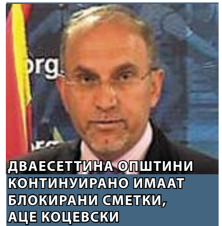
ДВАЕСЕТТИНА ОПШТИНИ КОНТИНУИРАНО ИМААТ БЛОКИРАНИ СМЕТКИ, АЦЕ КОЦЕВСКИ

Тој посочува дека во Европа има многу попрактични и посовремени решенија за кои Македонија треба да размисли и да ги прилагоди на своите потреби и интереси.