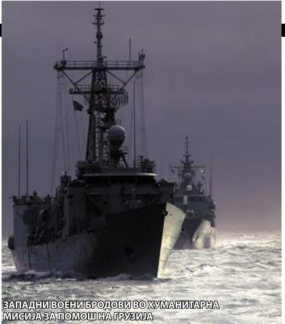
ЗАПАДНИ ВОЕНИ БРОДОВИ ВО ХУМАНИТАРНА МИСИЈА ЗА ПОМОШ НА ГРУЗИЈА

На 7 август, кога биле покренати воените дејства на Тбилиси против Јужна Осетија, завршена е големата американско-грузиска воена вежба, во која учествувале околу 1.000 припадници на американските сили. Русија ги отфрлаше повиците за пропорционална употреба на сила, потсетувајќи ги западните земји на нивната пропорционалност кога ја напаѓаа Србија пред девет години. Според информациите од Москва, во Грузија моментно работат 127 советници на Пентагон.