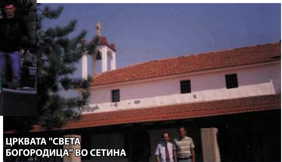
ЦРКВАТА "СВЕТА БОГОРОДИЦА" ВО СЕТИНА

"Доколку премиерот попусти тогаш ќе ја нема македонската нација. Ние треба да си ги зачуваме идентитетот и јазикот. Задоволни сме што прв пат, по