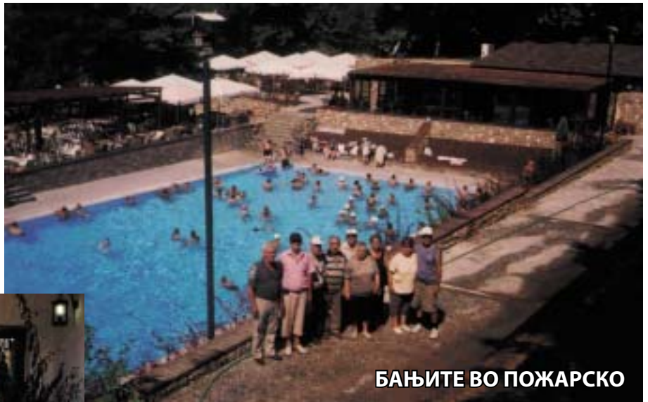
БАЊИТЕ ВО ПОЖАРСКО