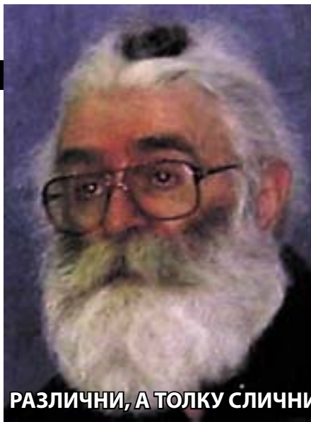
РАЗЛИЧНИ, А ТОЛКУ СЛИЧНИ... КАРАЏИЌ И САДАМ