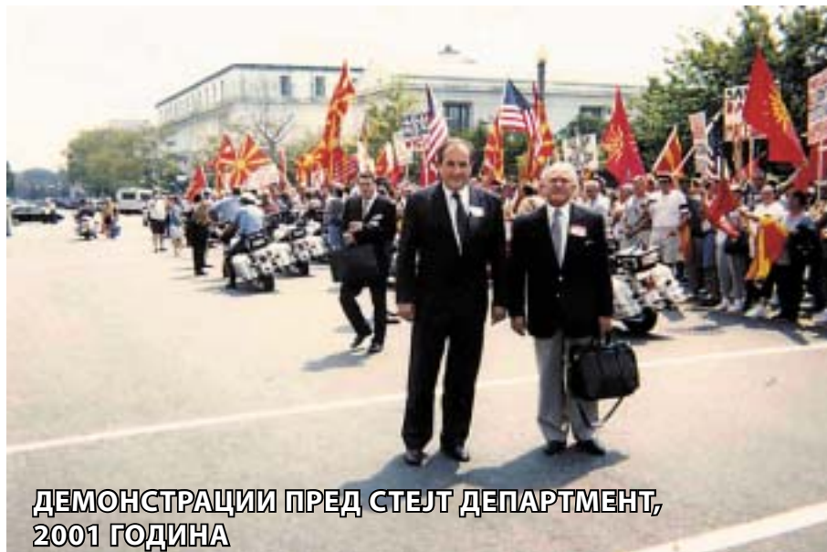
ДЕМОНСТРАЦИИ ПРЕД СТЕЈТ ДЕПАРТМЕНТ, 2001 ГОДИНА