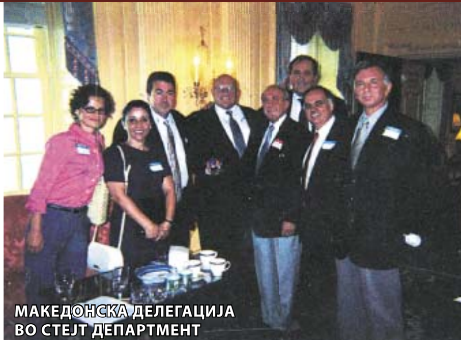
МАКЕДОНСКА ДЕЛЕГАЦИЈА ВО СТЕЈТ ДЕПАРТМЕНТ