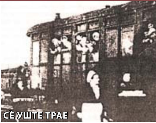
СÈ УШТЕ ТРАЕ