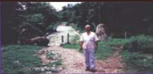
Пат од Кабул до Калкута, изграден од Македонците

Од книгата на Пандил Костурски и Ристо Поповски "Александар Македонски Македонизам"