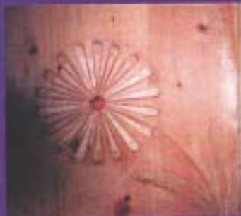
Култен симбол на Калешите-Македонци од Ханза