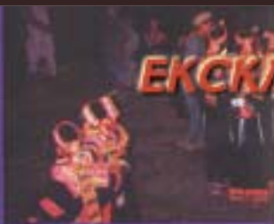
Жанска носија од Ханза