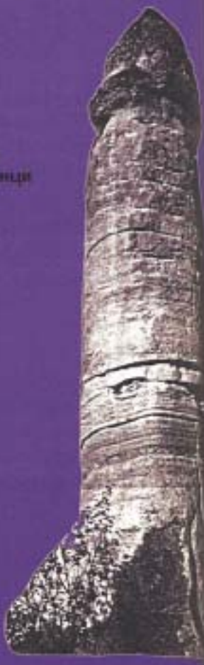
Живвалиште на Мама во Кападокија

следеле Александар биле, исто така, чести гости.