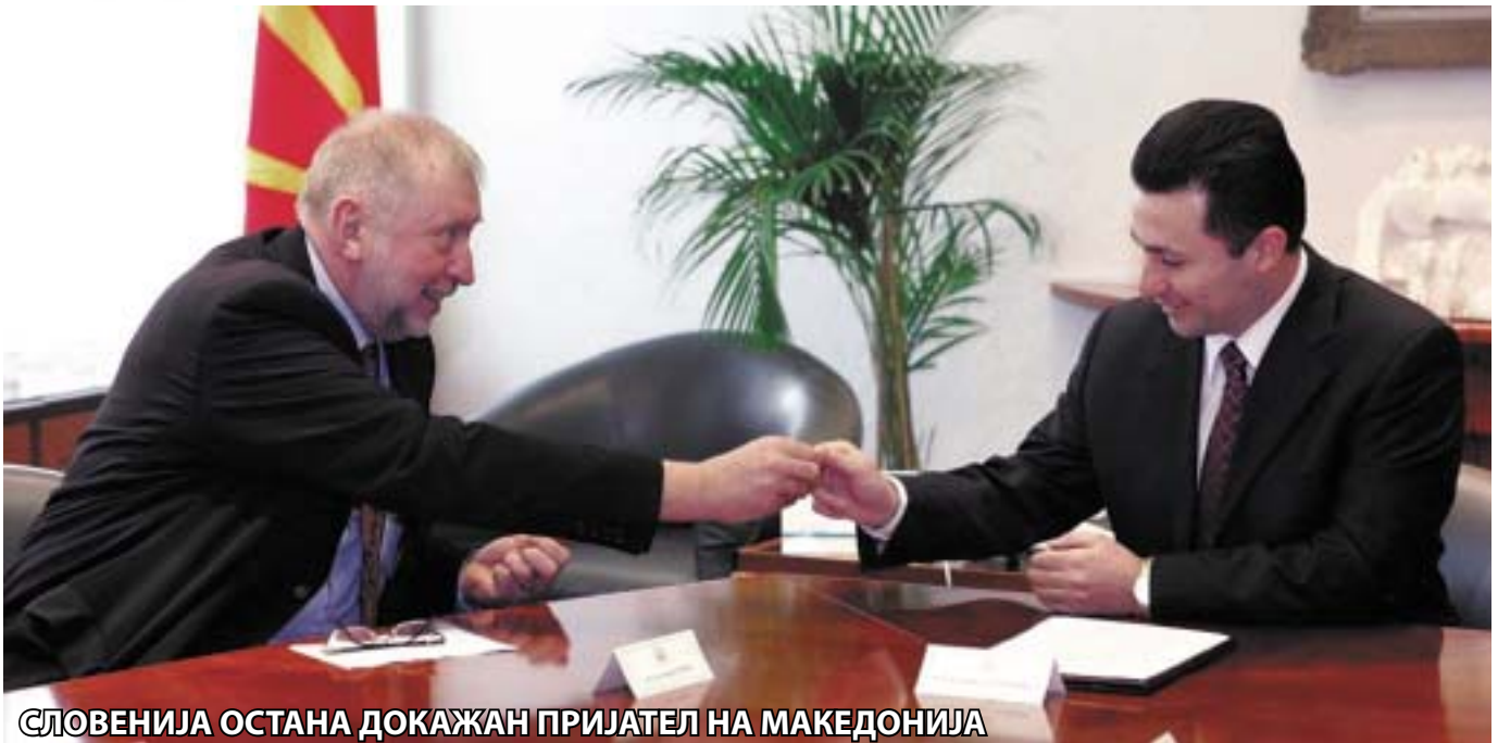
СЛОВЕНИЈА ОСТАНА ДОКАЖАН ПРИЈАТЕЛ НА МАКЕДОНИЈА