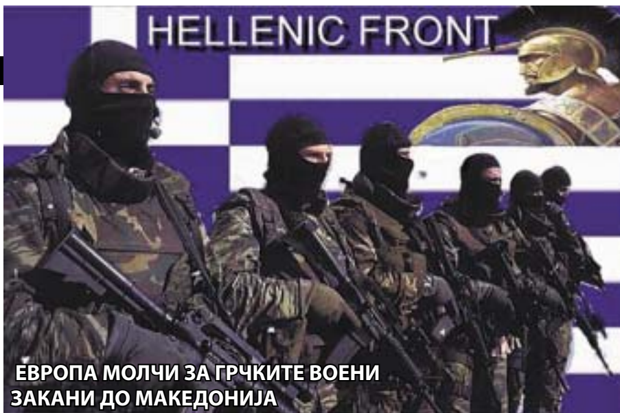
ЕВРОПА МОЛЧИ ЗА ГРЧКИТЕ ВОЕНИ ЗАКНИ ДО МАКЕДОНИЈА

само што го толерира, туку и го поддржува. Со тоа нам ни дава до знаење дека Европската унија претставува само збир на земји, кои меѓу себе се поддржуваат и им наметнуваат критериуми, услови и задачи на другите. За нив не важи ниту меѓународното право, ниту почитувањето на човековите права и слободи, ниту правилата кои им се даваат на другите, иако устите постојано им се полни со тие зборови. Тие се привилегирани и сè можат да прават само затоа што се земји-членки на Унијата. Е, на таков начин нема никогаш да се постигне европското единство. На таква Европа не ѝ предвидувам долго-