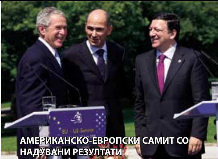
АМЕРИКАНСКО-ЕВРОПСКИ САМИТ СО НАДУВАНИ РЕЗУЛТАТИ

Но, очигледно е дека поделена Европа не дава резултати. А, поделена е и долж и попреку. Најголемите губитници од континенталното неединство секако ќе бидат малите и маргиналците. Како и вообичаено, на крај нивниот пораз ќе биде сведен под именителот на колатерална штета.