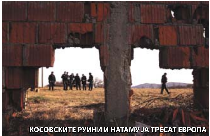
КОСОВСКИТЕ РУИНИ И НАТАМУ ЈА ТРЕСАТ ЕВРОПА

"Косово де факто е слободно и независно од 12 јуни 1999 година, кога на територијата влегоа силите на КФОР, додека де јуре е независно од 17 февруари оваа година. Во најтешките моменти за граѓаните на Косово на нивна страна и во нивните срца беа НАТО и пријателите на слободата и човековото достоинство. Слободата и независноста се остварени низ неколкудецениски напори, кои се водеа во системот на образованието, политичката и во вооружената борба. Во историско паметење ќе останат претседателот Ибрахим Ругова и легендарниот командант на ОВК, Адем Јашари".