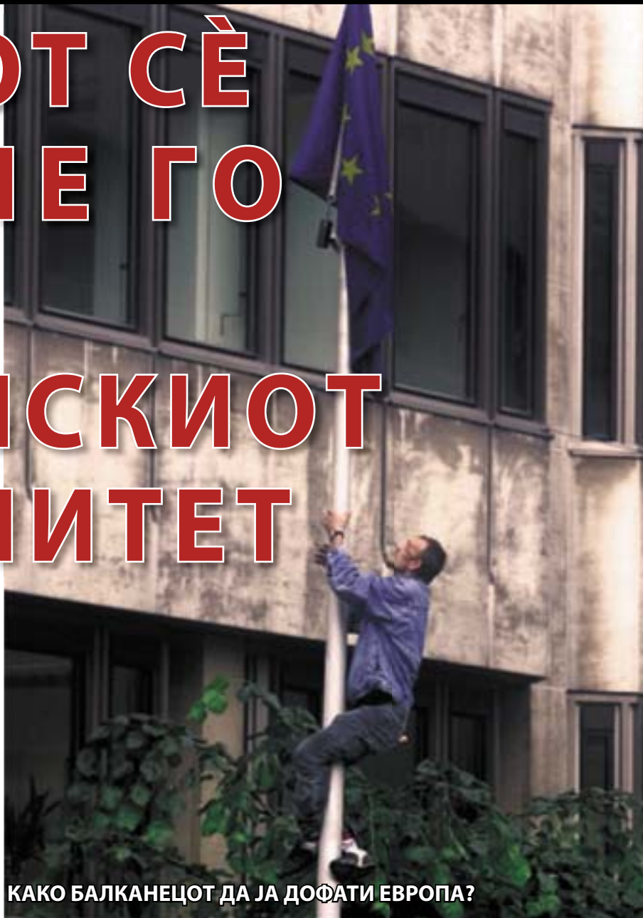
КАКО БАЛКАНЕЦОТ ДА ЈА ДОФАТИ ЕВРОПА?

отколку да постоеше целата држава во федералниот облик, кој го имаше. Веројатно сега ни сами не знаат да одговорот зошто придонесоа за нејзиното распаѓање.