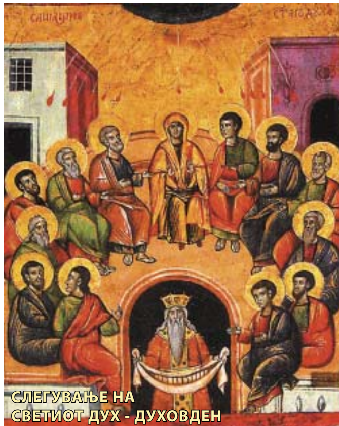
СЛЕГУВАЊЕ НА СВЕТИОТ ДУХ - ДУХОВДЕН

Да ве потсетам дека уште пред да се вознесе Господ Исус Христос на небото, Тој им дал заповед на апостолите да не се оддалечуваат од Ерусалим, туку да го чекаат ветувањето од Отецот, за кое тие слушале од Него: "Но, ќе примите сила кога врз вас ќе слезе Светиот Дух; и ќе Ми бидете сведоци во Ерусалим и во цела Јудеја и Самарија, и дури до крајот на земјата". (Дела 1, 8) Апостолите се вратиле во Ерусалим и кога се навршиле дните на Педесетницата (десет дена по Вознесението на Христос), во 9 часот наутро, Мајката Божја и апостолите се молеле во една ерусалимска куќа на Сион. Значи, 50 дена по Воскресението, кога сите тие биле заедно и еднодушни, се симнал Светиот Дух во вид на огнени јазици: "И ненадејно се слушна шум од небото, како да одеше силен ветар, ја исполни целата куќа, каде што седеа. И им се јавија разделени јазици, како огнени, и застанаа по еден над секого од нив. И сите се исполнија со Дух Свети и почнаа да зборуваат на други јазици, така како што им даваше Духот Свети да изговараат". (Дела 2, 1-4) Кога се слушал тој шум се собрал многу народ во Ерусалим и сите се чуделе што го слушаат својот роден јазик: Партјаните, Мидјаните, Еламитите, жителите од Месопотамија, Јудеја и Кападокија, од