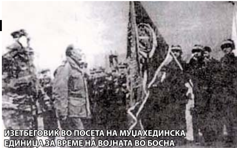
ИЗЕТБЕГОВИЌ ВО ПОСЕТА НА МУЏАХЕДИНСКА ЕДИНИЦА ЗА ВРЕМЕ НА ВОЈНАТА ВО БОСНА

"Исламот е заснован на морал, а не на корупција на граѓаните и други недела... Никогаш не сме контактирале со центрите на тероризмот во светот, бидејќи ние се бориме против тероризмот, а центрите на тој тероризам се наоѓаат во Њујорк и во Брисел. Не сум терорист и никогаш не би уривал верски објекти на ниту една религија. Се знае кој го прави тоа, Џорџ Буш. Јас сум носел српска пушка на моето рамо".