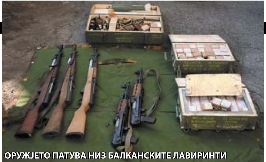
ОРУЖЈЕТО ПАТУВА НИЗ БАЛКАНСКИТЕ ЛАВИРИНТИ

"ИДНИОТ БАЛКАНСКИ КАЛИФАТ" - ДЕЛО НА АВТОРОТ КРИСТОФЕР ДЕЛИСО