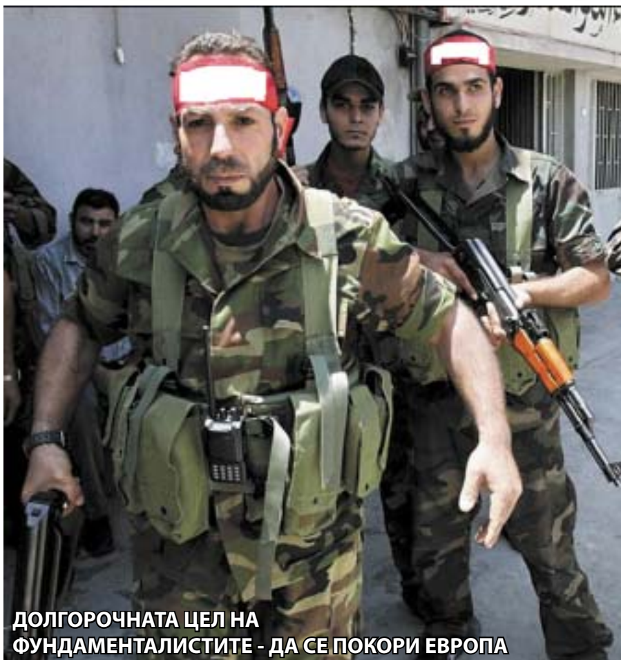
ДОЛГОРОЧНАТА ЦЕЛ НА ФУНДАМЕНТАЛИСТИТЕ - ДА СЕ ПОКОРИ ЕВРОПА