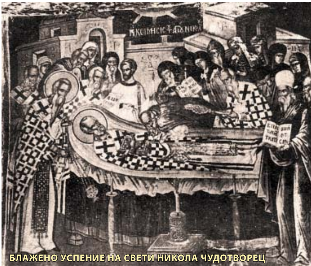
БЛАЖЕНО УСПЕНИЕ НА СВЕТИ НИКОЛА ЧУДОТВОРЕЦ

Со благослов на Неговото Високо Преосвештенство Митрополит г. Горазд