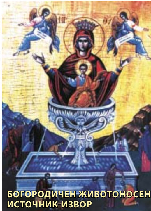
БОГОРОДИЧЕН ЖИВОТНОСЕН ИСТОЧНИК-ИЗВОР