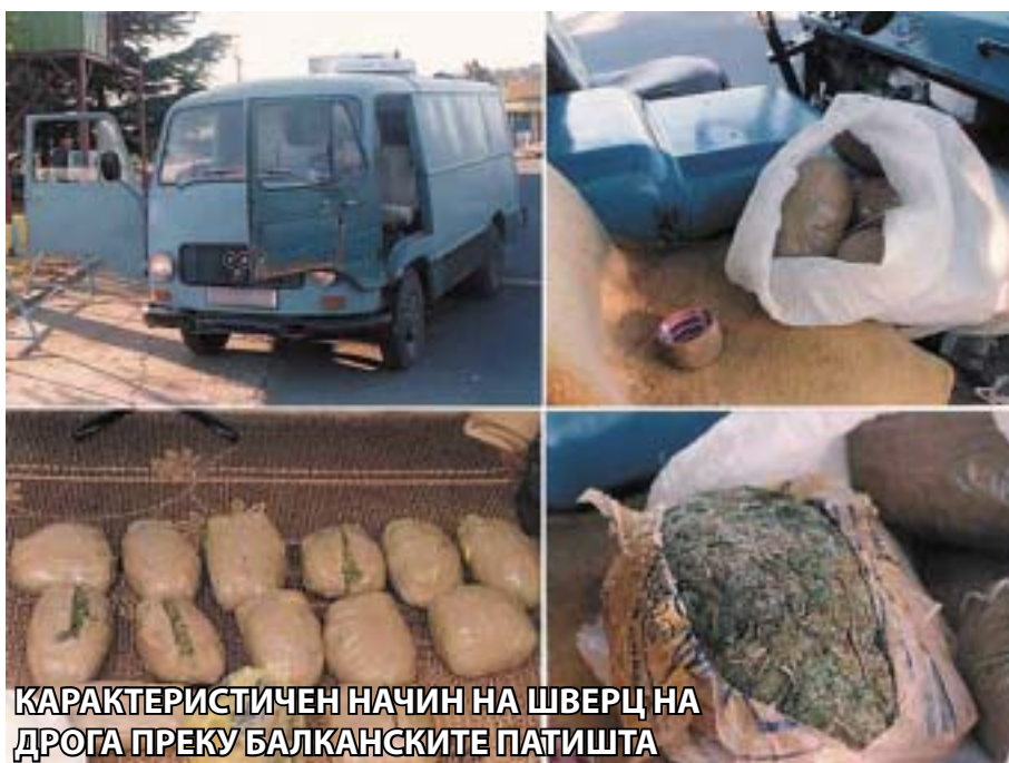
КАРАКТЕРИСТИЧЕН НАЧИН НА ШВЕРЦ НА ДРОГА ПРЕКУ БАЛКАНСКИОТ ПАТИШТА

на годишно ниво. Познато е дека нестабилните подрачја во Јужна Европа секогаш биле плодно тло за развој на шверцерските патишта преку кои се