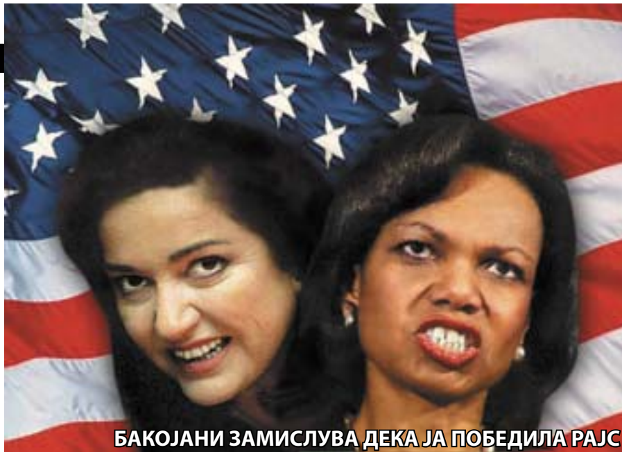
БАКОЈАНИ ЗАМИСЛУВА ДЕКА ЈА ПОБЕДИЛА РАЈС

За каков компромис зборуваат политичките пензионери во Македонија? Која е отстапката која Грција ќе ја направи? Се лажат "искусните" дека станува збор за компромис, тие воопшто