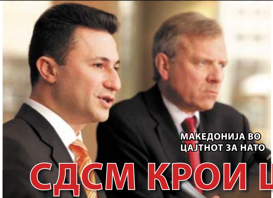
МАКЕДОНИЈА ВО ЦАЈТНОТ ЗА НАТО

З агатката НАТО и нашиот влез во оваа безбедносна институција е веќе решена. Самитот во Букурешт го дочекуваме релативно релаксирано, по сите турбуленции кои ги доживеавме во изминатиот месец, благодарение на нашиот политичко-државен врв, кој секојдневно нè шокираше со информации, пред сè, врзани за името на нашата држава, но и со потресите во Владата на Република Македонија, кои ѝ го дадоа шлагот на тортата. Тортата веќе е готова, барем за јавноста, но се чини дека наскоро може да биде комплетно стопена од претоплата атмосфера, која се создава веќе подолго време, во кујната на големите мајстори на слаткарството - законодавниот дом. Токму овде подолго време се подготвуваат врвни специјалитети, чии вкусови за јавноста ќе бидат познати веднаш по завршувањето на долгоочекуваниот Самит на НАТО. Всушност, токму тогаш ќе почне јавната лицитација на