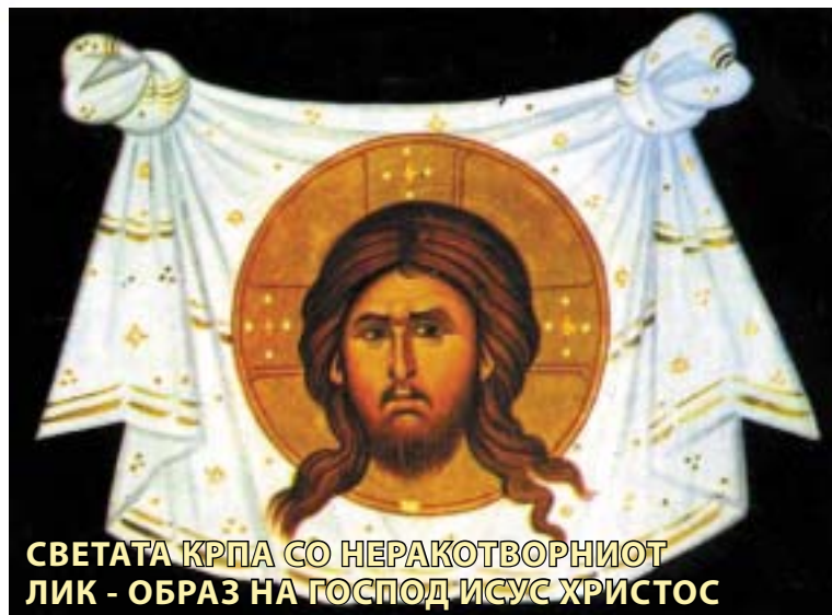
СВЕТАТА КРПА СО НЕРАКОТВОРНИОТ ЛИК - ОБРАЗ НА ГОСПОД ИСУС ХРИСТОС

Во времето на царот Ираклиј (кој царувал од 610 до 641 година), Грчкото царство истовремено го нападнале Персијците и Скитите. Војските на персискиот цар Хозрој и скитскиот Хаган, го нападнале Константинопол (Цариград). Сарвар, војвода на персискиот цар Хозрој и скитскиот кнез, со огромна војска пристигнале до Цариград, го опколиле и долго време го мачеле отцепувајќи го од преостанатиот свет. Тогаш патријархот Сергеј (патријарх на Константинопол), земајќи ги чесните крстови (од Чесното и Животворно дрво) и светите икони (особено Неракотворната Христова икона и Чудотворната икона Одигитрија - Патеводителка), како и Ризата на Пречистата Богомајка, почнал да ги обиколува градските ѕидини, со солзи вршејќи литии и молепствија. И по милоста Божја, со посредство на Пресвета Богородица, престојничката на чудесен начин била спасена од Варварите и на Грците им била дадена славна победа над Персијците и Скитите". Значи, Пресвета Богородица ги спасила христијаните од нехристијаните. "Зашто кога патријархот и духовништвото по усрдните молепствија пред иконата на Пречистата Богомајка ја спуштија Нејзината риза