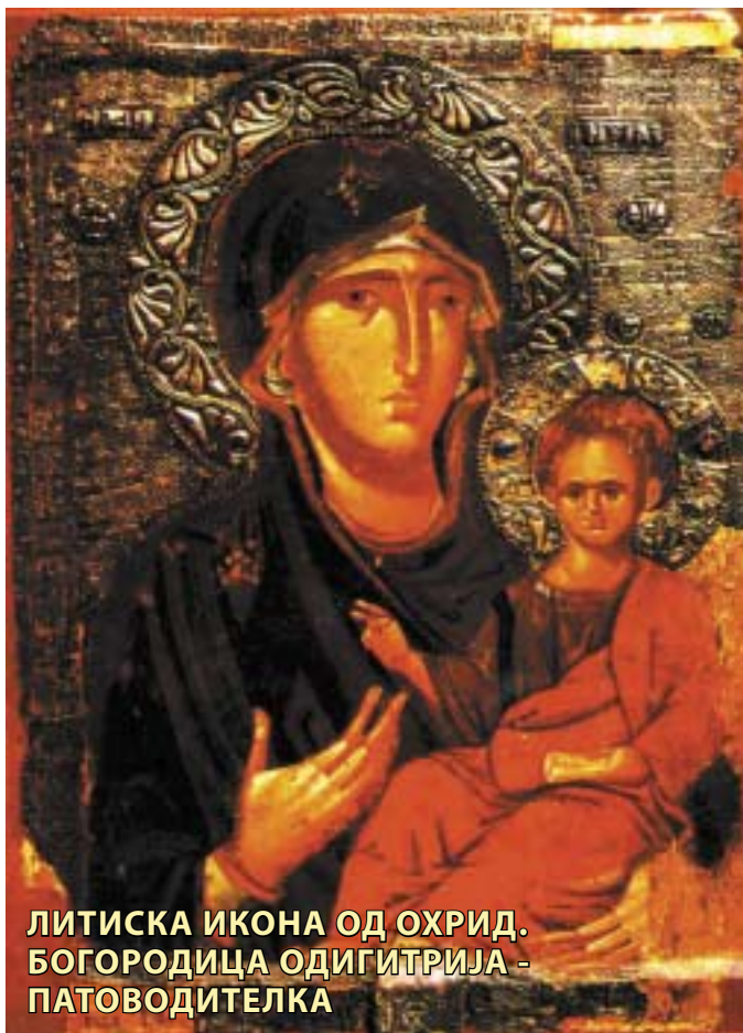
ЛИТИСКА ИКОНА ОД ОХРИД. БОГОРОДИЦА ОДИГИТРИЈА - ПАТОВОДИТЕЛКА

но и со восхитување, сите присутни на Богослужбата ја пеат повеќе пати прекрасната песна "Возбраној воеводје". Семилостивата Божја Мајка, која е Милост пред Творецот, ја молиме да го воздигне човештвото од земниот до небесниот свет.