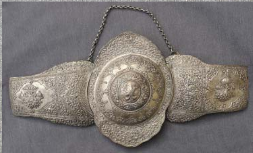
мите предмети изгледаат како да се везени на рака со игла 'чингелака'. Грижливо и многу професионално се чувале многу години, а зошто досега немало