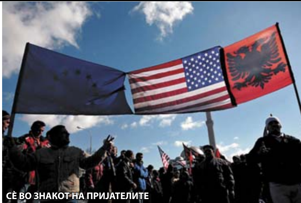
СÈ ВО ЗНАКОТ НА ПРИЈАТЕЛИТЕ

Овие големи стратегии не се нов изум на светската геополитичка сцена. Тие влегле во планот за реализација уште во ерата на Студената војна. Но, сега е дојдено време за нивно театрално спроведување. Влегуваме во временски период во кој недвосмислено се креира нов светски општествен поредок. Демократијата и правата се само изговор за постигнување на новите хегемонистички цели на моќните. На стартот на XXI век големите сили најпрво ги донесоа стратегиите за национална безбедност, кои патем ги опфаќаа и начините за управување со другите држави и светот во целина. Спомнатите