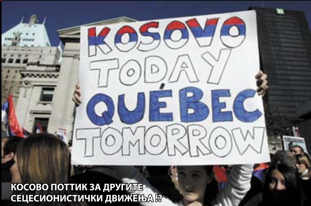
КОСОВО ПОТТИК ЗА ДРУГИТЕ СЕЦЕСИОНИСТИЧКИ ДВИЖЕЊА!?