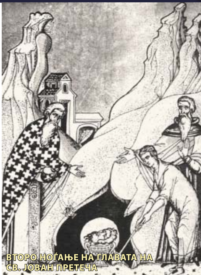
ВТОРО НОЃАЊЕ НА ГЛАВАТА НА СВ. ЈОВАН ПРЕТЕЧА

"Ete, vam sum vi daruvan. Stani i odi po yvezdata koja je odi pred tebe, i kade taa je te odvede, tamu raskopaj ja zemjata i je me najde{".