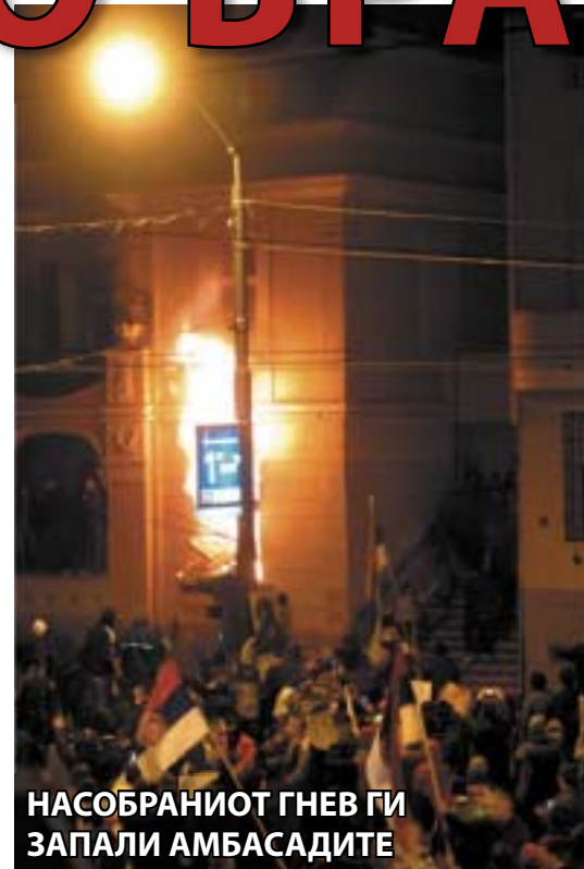
НАСОБРАНИОТ ГНЕВ ГИ ЗАПАЛИ АМБСАДИТЕ

канскиот печат очекува дека во наредниот период на Косово уште повеќе ќе завладеат незаконието и тероризмот, организираниот криминал ќе доживее нов процут, корупцијата ќе ги надмине максималните лимити. Заклучок е дека независноста ќе роди нови проблеми, а нема да реши ниту еден од постојните. Како и да е, загрозени ќе бидат и виталните интереси на западните земји, бидејќи со самото уривање на постулатите на Повелбата на Обединетите нации и меѓународното право, создаден е преседан кој испишува нова страница во светската политичка практика. Имајќи предвид дека тероризмот и организираниот криминал се двете области на кои САД им посветуваат најголемо внимание, случајот со Косово само ќе создаде уште една слика на не-