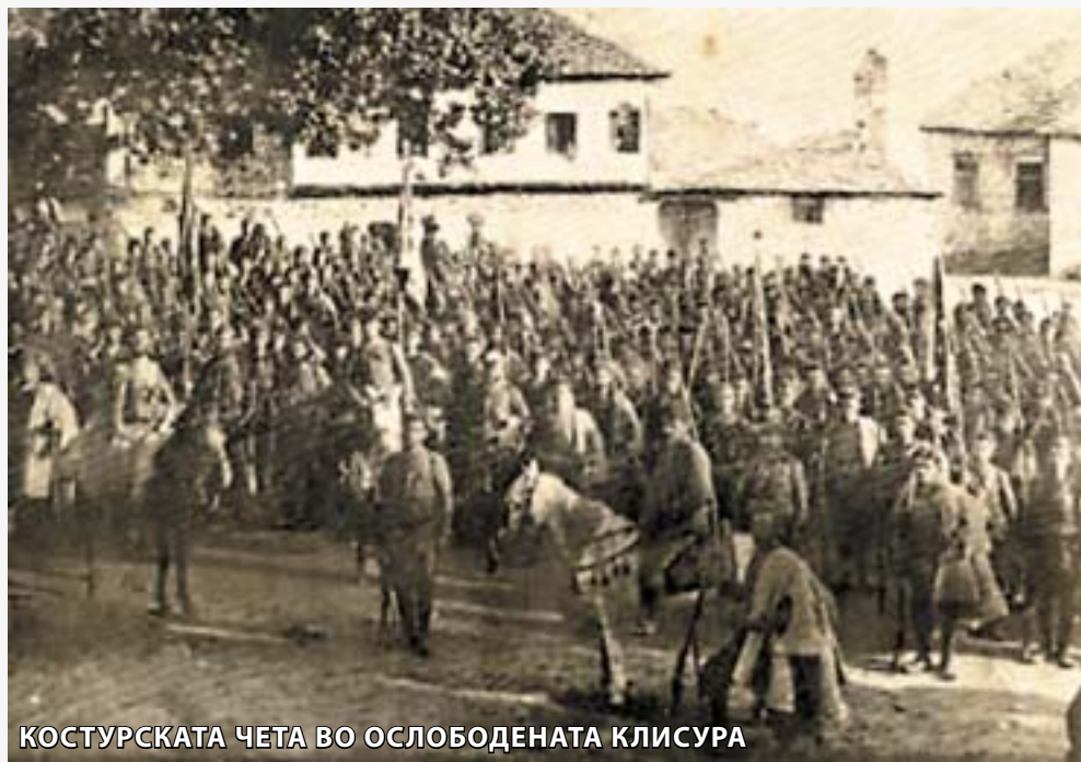
КОСТУРСКАТА ЧЕТА ВО ОСЛОБОДЕНАТА КЛИСУРА

говараат. Значи, останува третото, ако сме сигурни дека ќе постои бунт".