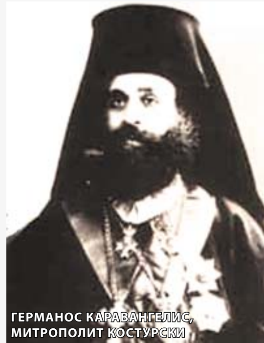
ГЕРМАНОС КАРАВАНГЕЛИС, МИТРОПОЛИТ КОСТУРСКИ

Изненаденоста во прв момент кај грчката Влада од масовното учество на македонското население во востанието, во текот на истото, премина во паника и национална хистерија. Грчката држава не избираше средства во битката за негово што побрзо задушување, акциите беа насочени, главно, во Македонија, во Грција и во презентирање негативна слика во светот за случувањата во востанатите реони. Најголема загриженост Грција покажа за учеството на македонското патријаршиско население во востанието, прогласено за грчко врз основа на Милет системот, кој Цариградската патријаршија, а потоа и грчката држава го претворија во националистичка институција за реализирање на своите национални програми и планови. Од информациите кои ги добиваше грчката Влада од Македонија, на Атина ѝ стана јасно дека мора да преземе мерки, и тоа веднаш, ако и натаму сака да се "повикува" на правото да претендентира на Македонија. Најважната задача која си ја постави Владата во Атина беше: "На секој начин и по секоја жртва треба нашите и бугарофоните (Македонци патријаршисти, з.н.) да се одвојат од шизматиците (Македонци егзархисти, з.н.)" (Г.Петцивас, И.Драгумис: Та