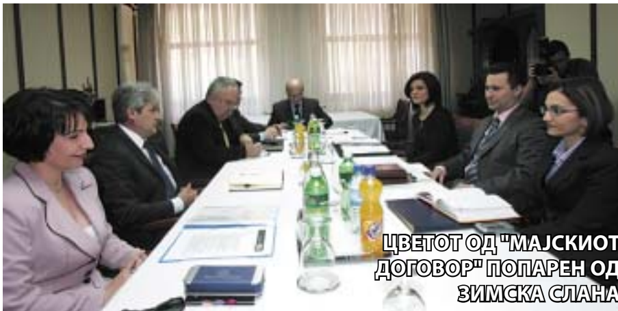
ЦВЕТОТ ОД "МАЈСКИОТ ДОГОВОР" ПОПАРЕН ОД ЗИМСКА СЛАНА

вен договор за употреба на малцинските јазици може земјава да ја однесе во безизлезен корсокак. Партијата на Ахмети по малку е осоколена и од дипломатскиот притисок кој врз Македонија го вршат претставници на меѓународната заедница. Нивната перфидна игра внесува застој во реформите, на кои тие инсистираат и непотребно влегуваат во лавиринт од кој потоа тешко се излегува. Измените во законодавството, кои ги бараат меѓународните дипломати, ја прават Македонија бинационална држава. Форсирањето на албанскиот јазик за втор службен во државата на сите општествени нивоа и