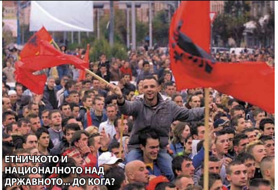
ЕТНИЧКОТО И НАЦИОНАЛНОТО НАД ДРЖАВНОТО... ДО КОГА?

Вистината е дека се борат за опстојување на тронот и за доаѓање на тронот. Нешто меѓу тоа е успехот на Македонија. Доколку тој се случи, веројатно ќе биде "коллатерална штета", случајно постигнат, бидејќи некој од надвор повеќе и подобро мисли за нас, отколку самите ние.