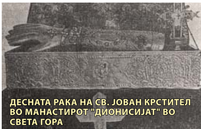
ДЕСНАТА РАКА НА Св. ЈОВАН КРСТИТЕЛ ВО МАНАСТИРОТ "ДИОНИСИЈАТ" ВО СВЕТА ГОРА

Се пее црковната песна: "Гласот Господов - над водите извикува...!" Со песни ги прославуваме големината и чудата Божји: "Велик си, Господи, и чудни се твоите дела и ниеден збор не е доволен да ги испее Твоите чуда". Тропарот, химната на празникот Богојавление, гласи: "Кога во Јордан се крштеваше, Господи, се потврди поклонувањето на Света Троица: гласот на Оца сведочеше за Тебе и Те нарече