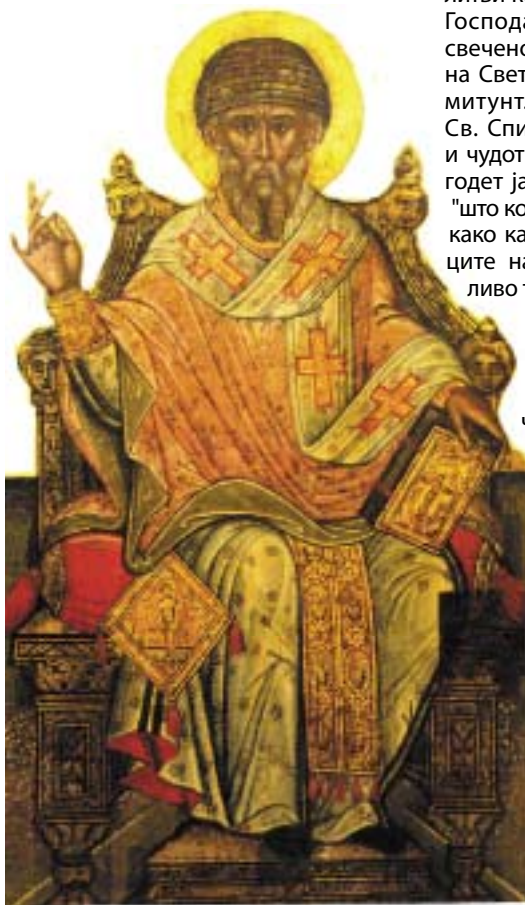
СВЕТИ СПИРИДОН ЧУДОТВОРЕЦ

Со благослов на Неговото Високо Преосвештенство Митрополит г. Горазд