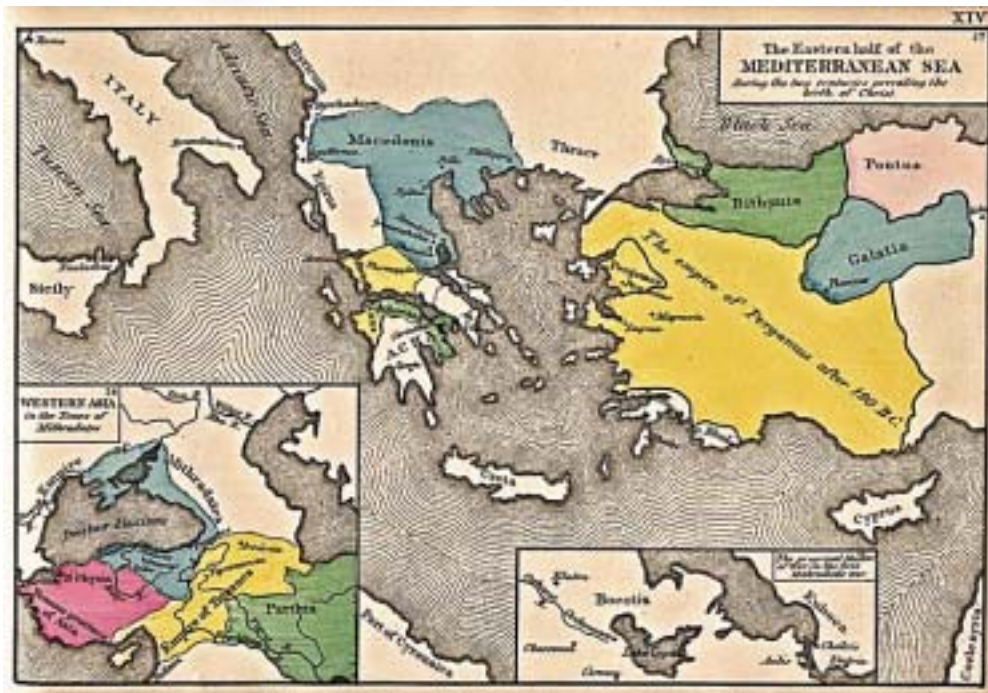
МАПА НА ИСТОЧНИОТ ДЕЛ ОД СРЕДОЗЕМНОТО МОРЕ, ДВА ВЕКА ПРЕД РАЃАЊЕТО НА ХРИСТОС

П родолжува дрската пропаганда на грчката држава. На секое место, во секоја пригода, пред сите европски слоеви. Секојдневното удирање по нашите плеќи со најпогрдни изрази, тонови и реторики е јасен доказ за наклонетоста кон иредентизмот на јужниот сосед. Потоа ќе нè обвинат нас дека ние сме тие кои ги сопнуваме Грците, кои го уриваме нивниот историски мит. Во реалноста е сосема поинаку, во