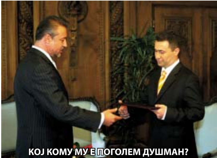
КОЈ КОМУ МУ Е ПОГОЛЕМ ДУШМАН?