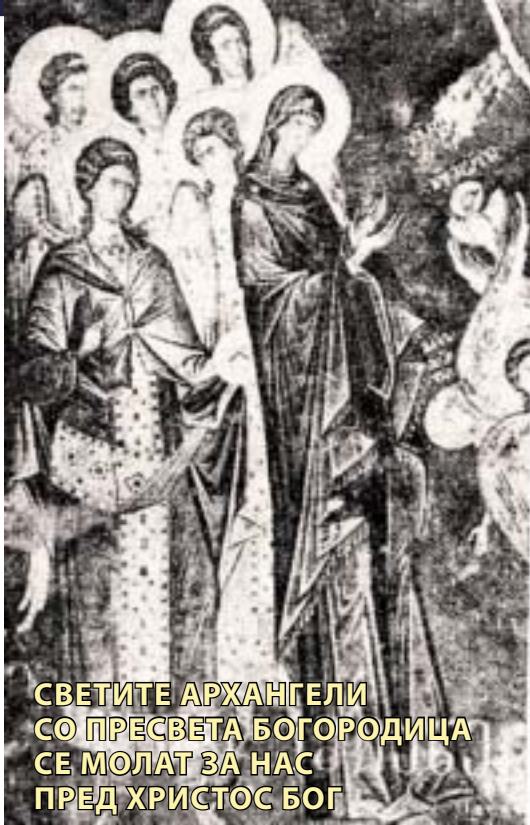
СВЕТИТЕ АРХАНГЕЛИ СО ПРЕСВЕТА БОГОРОДИЦА СЕ МОЛАТ ЗА НАС ПРЕД ХРИСТОС БОГ

од ангелите. Настанала страшна војна на небото. Архангел Михаил храбро застанал на чело на целиот Собор од ангели и возвикал пред неотпаднатите ангели: "Да внимаваме! Да застанеме добро, да застанеме со страв. Да стоиме смерно пред нашиот Создател и да не помислиме на тоа што е спротивно на Бога! Да погледнеме какви страдања претрпеа оние кои заедно со нас беа создадени, и досега заедно со нас беа причасници на Божествената светлина! Да обрнеме внимание како тие, заради горделивоста, ненадејно од светлината се урнаа во темнината и од висината се струполија во бездна!" Тогаш заедно со него сите Божји ангелски војски ја запеале торжествената песна: "Свет, Свет, Свет, Господ Саваот! Полни се небесата и земјата со Твојата слава". Поради тоа што ангелите сложно и едногласно запеале славејќи ги Отецот и Синот и Светиот Дух, таквото соединување на сите свети ангели добило назив Собор на ангелите. На 21 ноември, за спомен на овој Собор е востановен овој празник, со кој им се оддава слава на сите небесни војски.