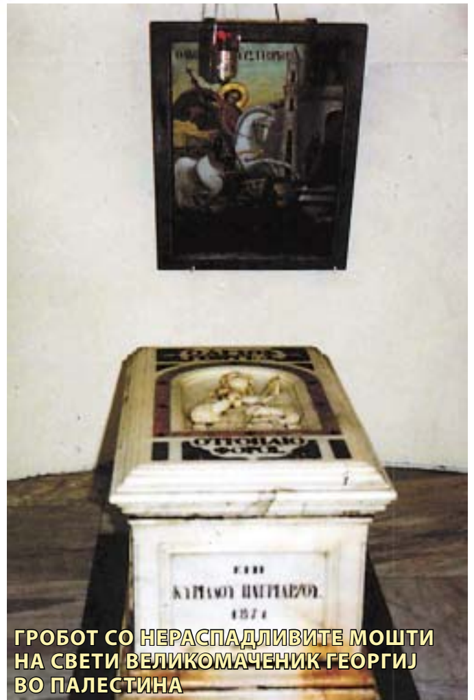
ГРОБОТ СО НЕРАСПАДЛИВИТЕ МОШТИ НА СВЕТИ ВЕЛИКОМАЧЕНИК ГЕОРГИЈ ВО ПАЛЕСТИНА

Познато е дека Козма му се налутил на својот брат Дамјан затоа што тој примил три јајца од некоја жена по име Паладија. Таа била тешко болна и многу лекари не можеле да ја излекуваат. Светите браќа отишле во нејзиниот дом и ја исцелиле. Благодарна на овие лекари таа сакала да им даде нешто како подарок. Но, тие од никого ништо не примале. Не ја продавале благодетта која им