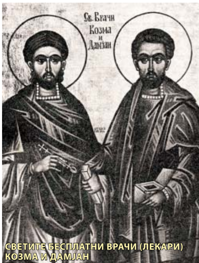
СВЕТИТЕ БЕСПЛАТНИ ВРАЧИ (ЛЕКАРИ) КОЗМА И ДАМЈАН

Со благослов на Неговото Високо Преосвештенство Митрополит г. Горазд