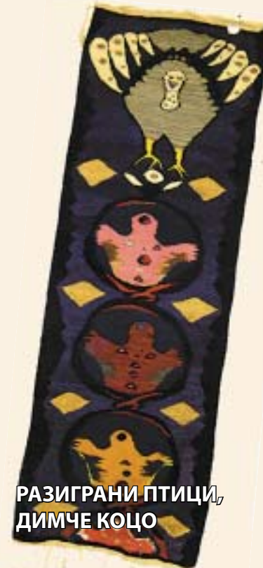
РАЗИГРАНИ ПТИЦИ, ДИМЧЕ КОЦО