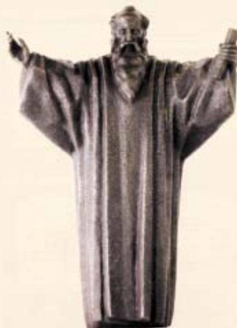
КЛИМЕНТ ОХРИДСКИ, ДИМО ТОДОРОВСКИ