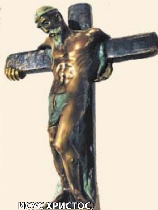
ИСУС ХРИСТОС, ТОМЕ СЕРАФИМОВСКИ