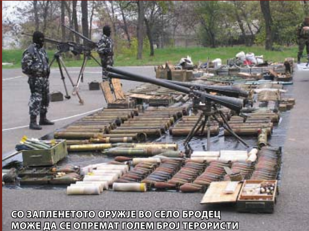
СО ЗАПЛЕНЕТОТО ОРУЖЈЕ ВО СЕЛО БРОДЕЦ МОЖЕ ДА СЕ ОПРЕМАТ ГОЛЕМ БРОЈ ТЕРОРИСТИ

Доколку внимателно се следи реакцијата на косовските власти може да се забележи дека тие се оградуваат од случувањата во Македонија, во кои главни актери беа пребегнати затвореници од "Дубрава". Значи, под знак прашање не се става исходот од преговорите за статусот на Косово, туку поканата на Република Македонија за членство во НАТО. Ваквите инциденти на безбедносен план, но и пошироко на политички план, не одат во прилог на евроатлантските аспирации на Република Македонија.