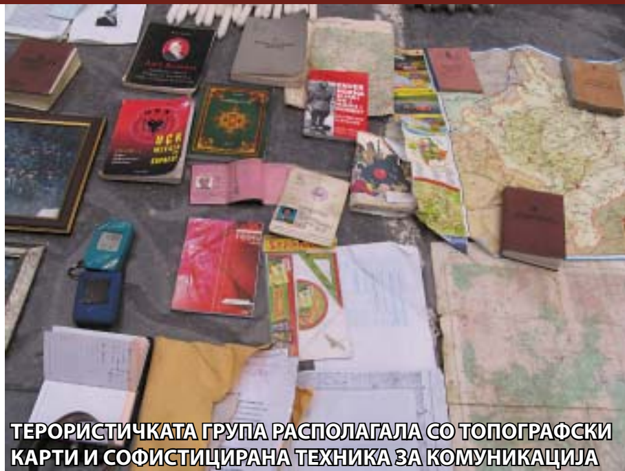
ТЕРОРИСТИЧКАТА ГРУПА РАСПОЛАГАЛА СО ТОПОГРАФСКИ КАРТИ И СОФИСТИЦИРАНА ТЕХНИКА ЗА КОМУНИКАЦИЈА